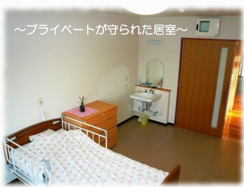
～プライベートが守られた居室～