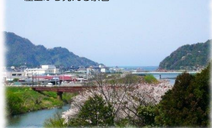
～屋上から見える景色～