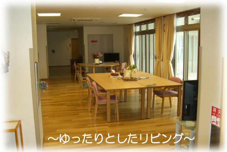
～ゆったりとしたリビング～